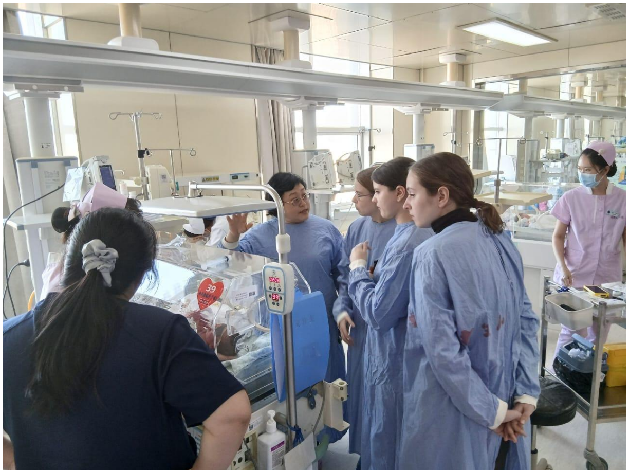
Блок реанимации новорожденных больницы