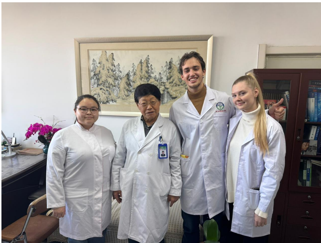
Наш новый знакомый, шеф!

За чашкой кофе, который был приготовлен самим главным врачом и ведущим специалистом первой харбинской больницы, обсудили насущные вопросы и дальнейшие перспективы сотрудничества, вспомнили былые времена шефа!