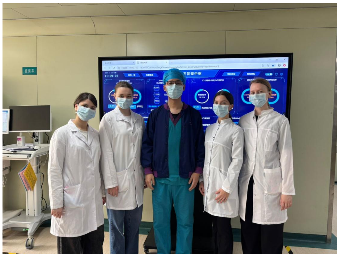
Экскурсия в сердце медицины: студенты ДВГМУ в отделении реанимации