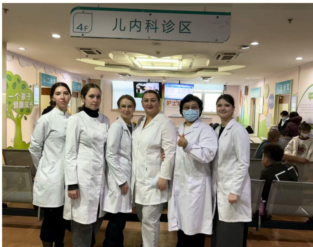
Педиатры в поднебесной

Также удалось посетить педиатрическое отделение и познакомиться особенностями педиатрической помощи детям.