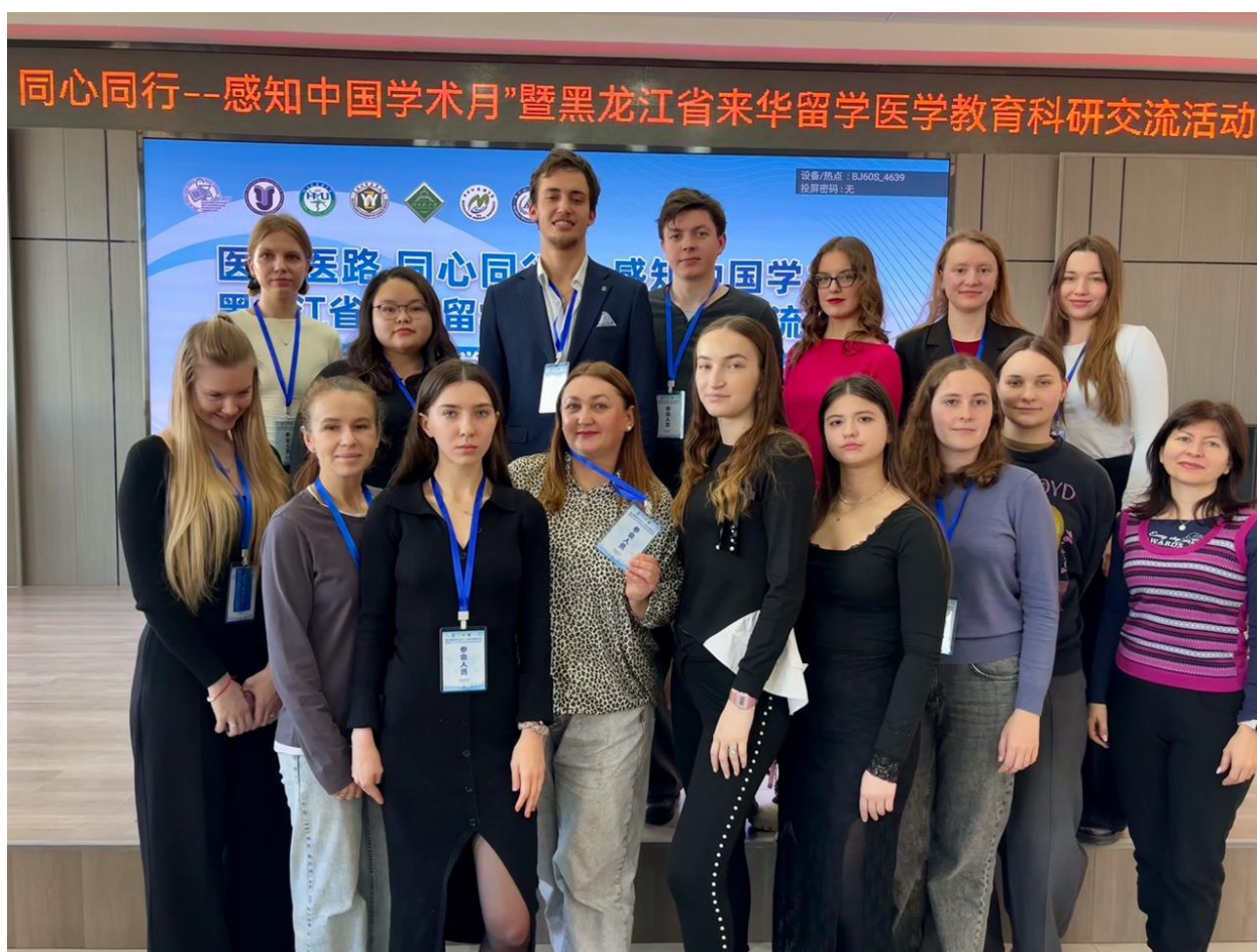
Научный мост между странами: стажеры ДВГМУ на образовательной конференции в Харбинском медицинском университете

С первых минут конференции нас встретила атмосфера высокого профессионализма и дух академического братства. Мероприятие собрало молодых ученых, исследователей и клиницистов из разных стран, что позволило взглянуть на современные вызовы медицины под разными углами. Высокий уровень организации и гостеприимство китайских коллег создали идеальные условия для продуктивного диалога и обмена знаниями!!!