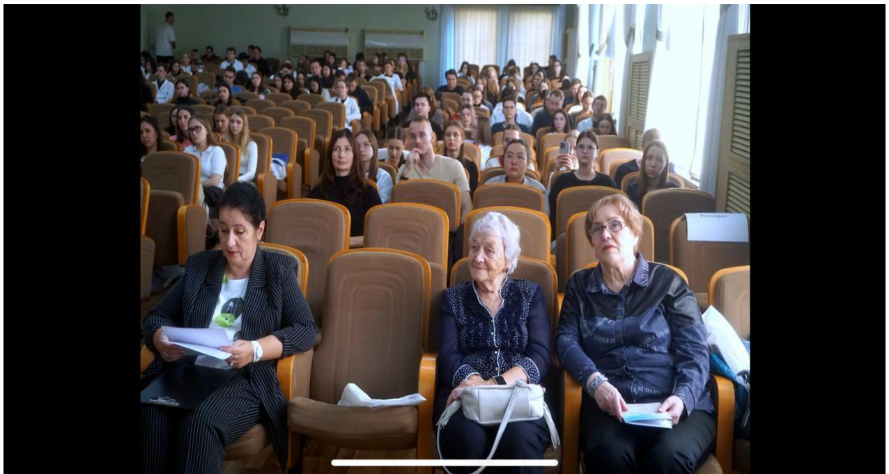
Участники конференции врачи педиатры